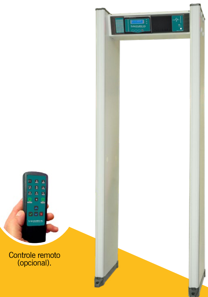
Controle remoto (opcional).