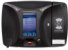
Registro Eletrônico de Ponto Portaria 1510 - Homologado INMETRO