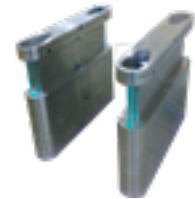
Bloqueios eletrônicos de alto padrão