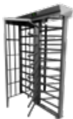
Torniquetes Pintado, Inox 304 e Inox 316L