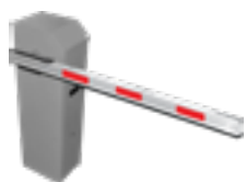
Soluções de estacionamento (Cancelas e Tags)