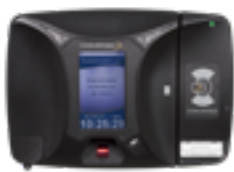
Registro Eletrônico de Ponto Portaria 1510 - Homologado INMETRO