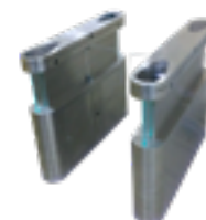
Bloqueios eletrônicos de alto padrão