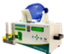
Suporte Respiratório Automatizado