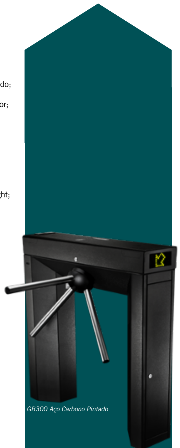
GB300 Aço Carbono Pintado

Obs: Os tipos de leitura deverão funcionar de forma conjugada ou isolada.