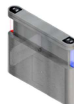
Bloqueios eletrônicos de alto padrão