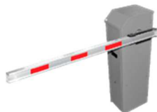
Soluções de estacionamento (Cancelas e Tags)