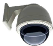
CFTV Câmeras térmicas e visuais, NVR'S, DVR'S e serviços de monitoramento