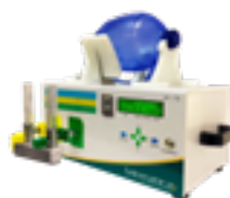
Suporte Respiratório Automatizado