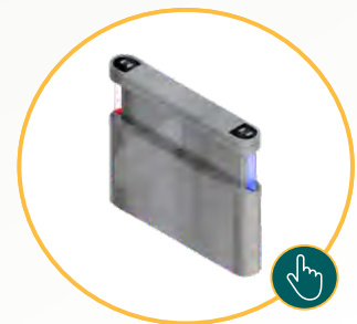
Bloqueios eletrônico de alto padrão

Soluções em Segurança • Soluções de acesso • Software de Gestão • CFTV • Registro eletrônico de ponto