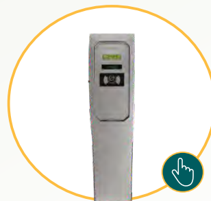
Totem - Gestão de estacionamento