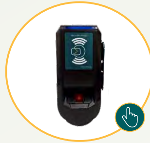
Controlador de acesso