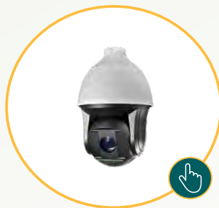
CFTV Câmeras térmicas e visuais, NVR'S, DVR'S e serviços de monitoramento