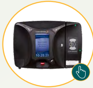
Registro Eletrônico de Ponto Portaria 671. Homologado pelo INMETRO