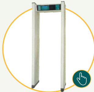
Detector de metais