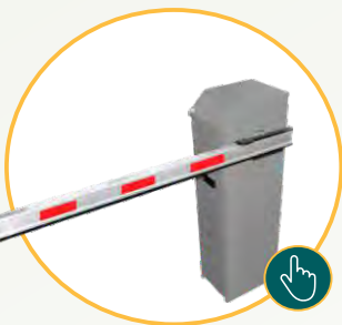
Soluções de estacionamento (Cancelas e Tags)